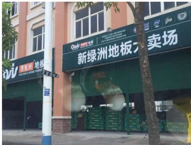
图表 4：普纳度板芙店大楼侧面的照片（摘录自首次覆盖报告）

新绿洲是中国家居 2014-2016 年的最大客户，亦是中国家居 2013 年的第二大客户。首先，如我们在首次覆盖报告所讲述，新绿洲与中国家居在板芙共享同一个办公室：