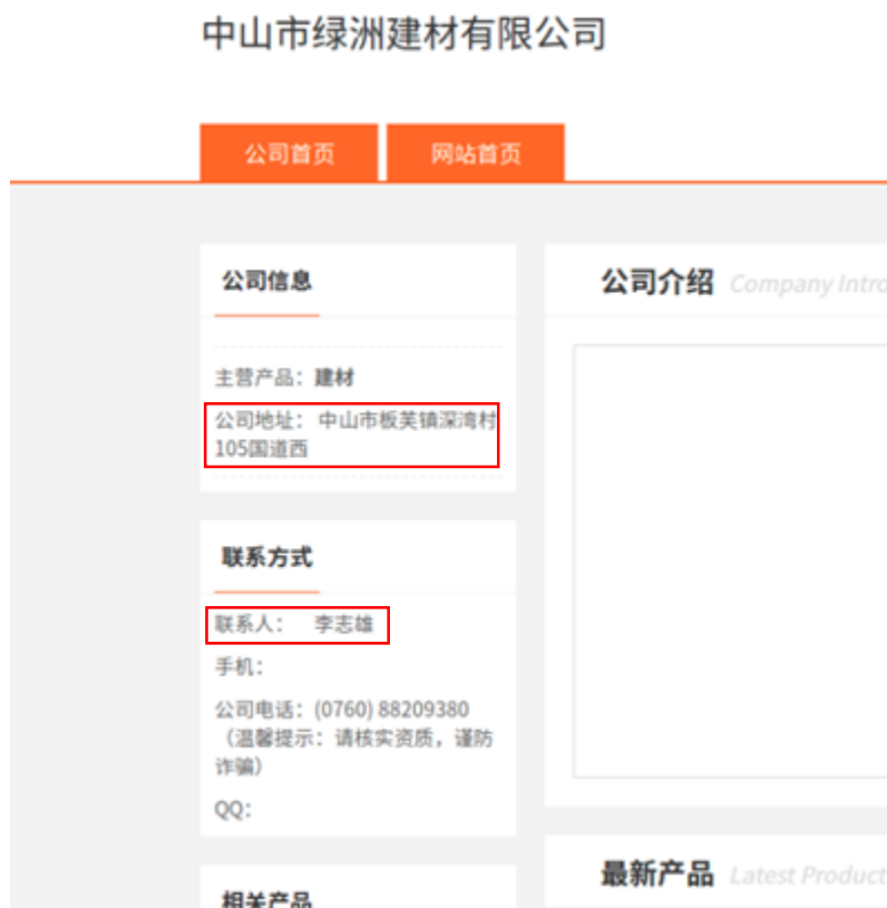
图表8：黄页网站有关绿洲建材的详细资料

资料来源： http://563472.23ape.org ，于2017年8月20日截取